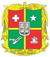
Municipio El Carmen de Viboral