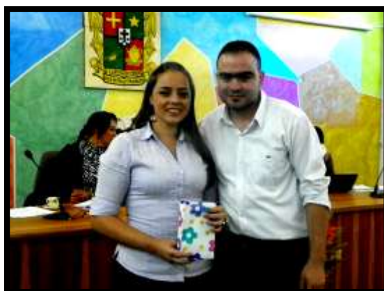
Reconocimiento por Día de la Secretaria.