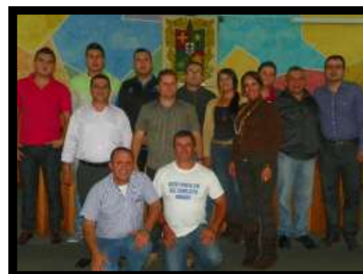
Celebración Día del Padre