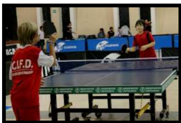
Presencia en el Campeonato Nacional de Tenis de Mesa