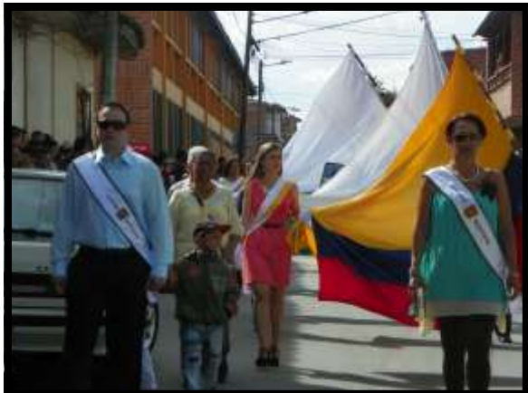
Desfile Fiestas Patronales de la Virgen de El Carmen.