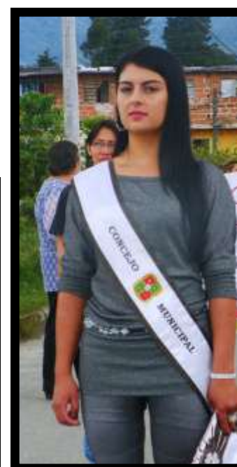
Fiestas Patronales de la Parroquia San José