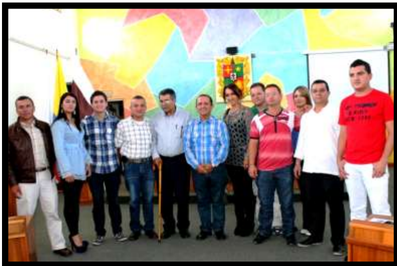
Presencia del Dr. Andrés Uriel Gallego, ex Ministro de Transporte, para conversatorio sobre transporte y vías principales.