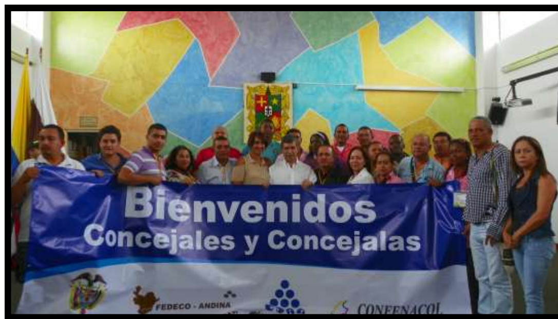
Congreso Nacional de Concejales realizado en El Carmen de Viboral con la participación del Ministro de Trabajo Rafael Pardo.