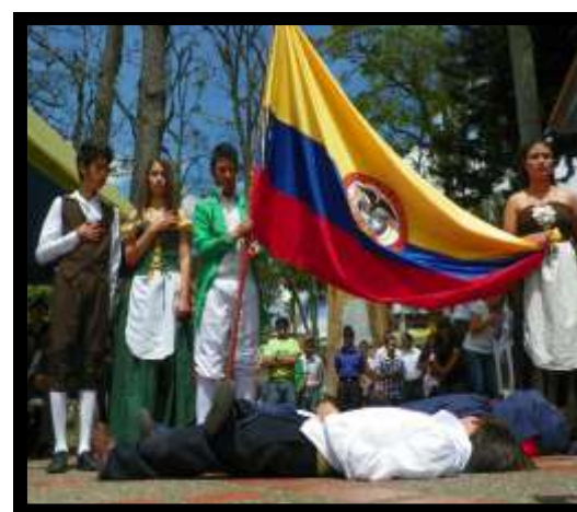
Celebración 20 de Julio. Parque Principal.