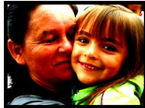
Evento "Abrazatón por los derechos de los niños"