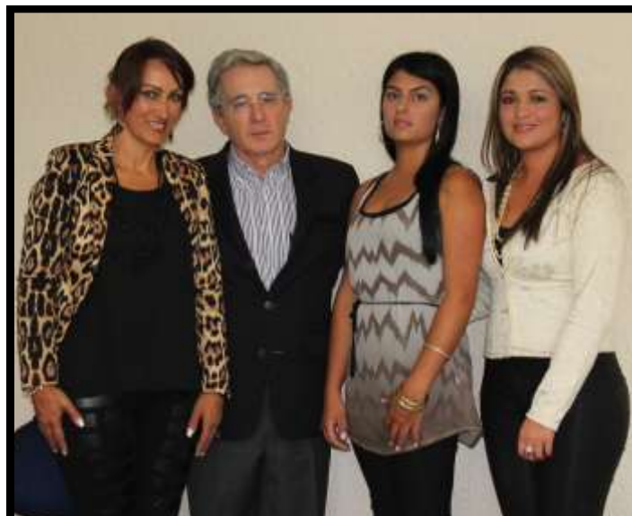
La Mesa Directiva del Concejo Municipal abordó temas municipales con el ex mandatario nacional; poniéndolo al día en relación al presupuesto para este año, la economía, los empréstitos realizados, la actualización catastral, entre otros diálogos que no dejaron escapar la tradición ceramista en esta bella población.