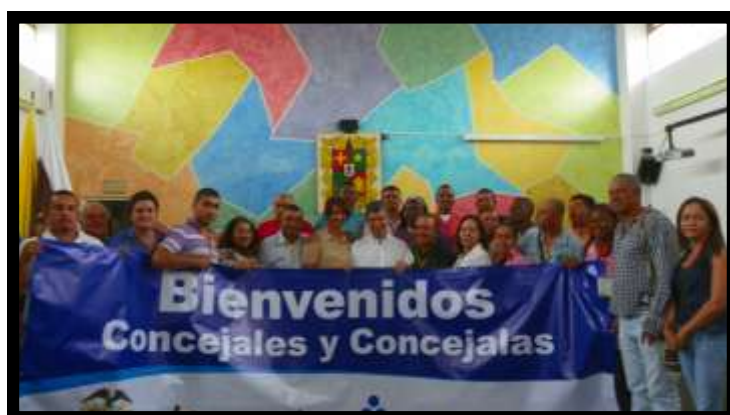
Congreso Nacional de Concejales