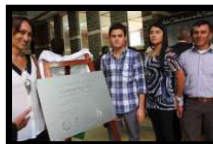
Inauguración Ciudadela del Siglo XIX. Nuevas Instalaciones Universidad de Antioquia Seccional Oriente.