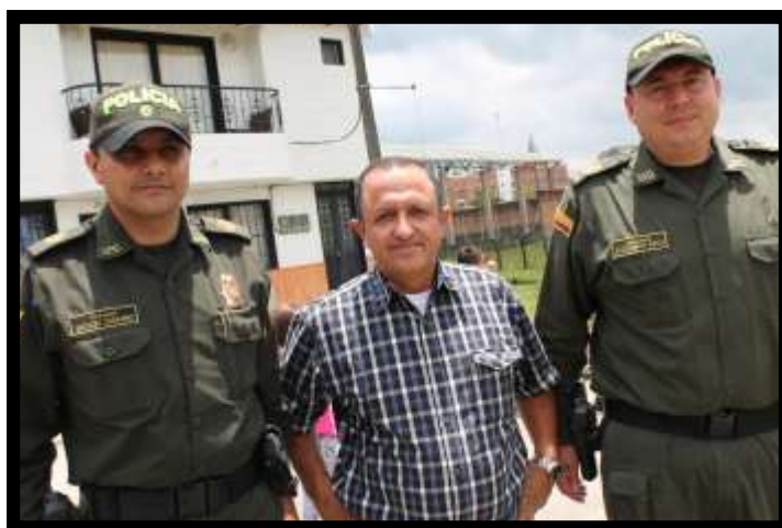
Visita Coronel de la Policía Antioquia, Sr. Gustavo Chavarro a El Carmen de Viboral.

La Ministra de Transporte, Dra. Cecilia Álvarez incluyó a El Carmen de Viboral en el programa "Ruta de la Ejecución", espacio en el cual este Ministerio visita distintas regiones del país para conocer los procesos de infraestructura y transporte que se han efectuado en las localidades.